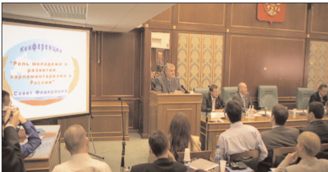
24.06.04 г. Москва. Совет Федерации. Конференция "Роль молодежи в развитии парламентаризма в России"

"Народная инициатива" - как визитная карточка будущей России - стр. 15