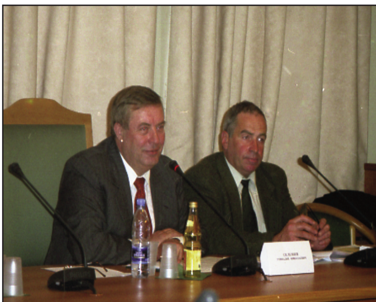
22.06.04 г. Государственная дума РФ. На заседании Круглого стола "Амортизация основного капитала для целей структурной промышленной политики и интеграции"

Орган регионального общественного движения "Народная инициатива"