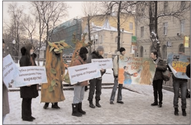
2008 г. 23 декабря. Москва. Пикет против вырубки леса в заказнике "Большой Утриш"

начальная, и конечная точки дороги находятся совсем не там, где это предусмотрено проектом, т.е. строительные работы ведутся с грубейшими отступлениями от проекта.