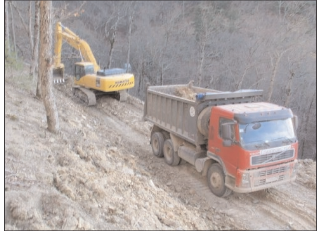
2008 г. ноябрь. Вырубка реликтового леса под строительство дороги Сукко-Утриш