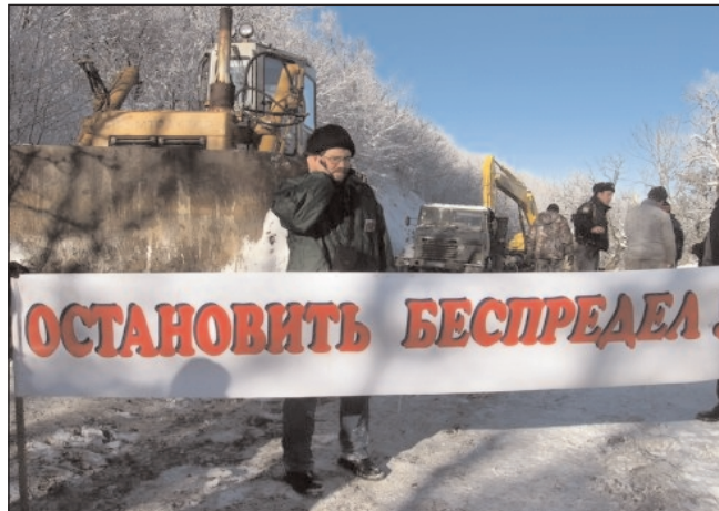
Унять экологов, прибыло все УВД г. Анапы во главе с начальником.