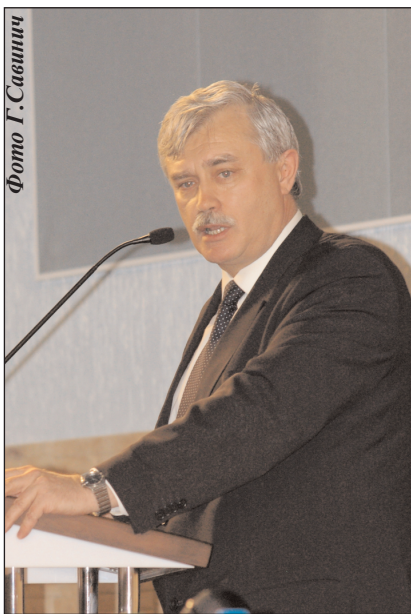
Георгий Полтавченко на презентации книги "Мир без России". 02.01.09 г.

Далека от российской действительности и ее характеристика как диктатуры. Нельзя подменять