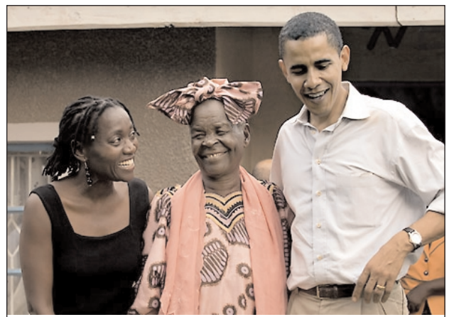
Семья в Кении: сестра сенатора Аума Обама и его бабушка Сара Хусейн Обама рядом с ее домом в деревне Когело.