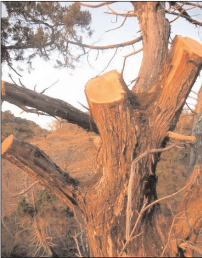
Этим, занесенным в Красную Книгу, можжевельникам было более 300 лет.