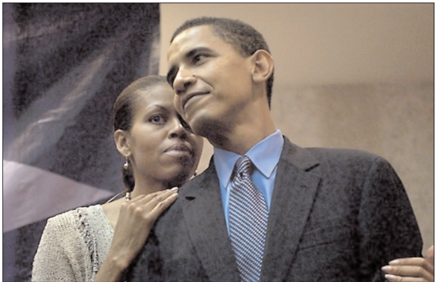
Супруги Мишель и Барак Обама.