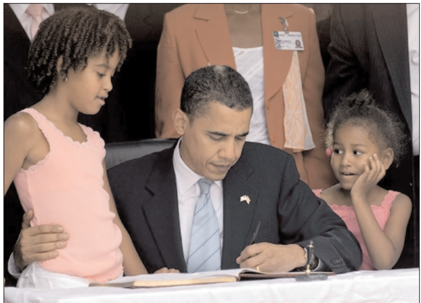
Сенатор Барак Обама с дочерьми Малией (слева) и Сашей, оставляет запись в книге соболезнований на месте взрыва американского посольства в Найроби, Кения

Настало также время модернизировать наши школы - не только ради работающих родителей, но и для того, чтобы помочь подготовить наших детей к жизни в мире с усилившейся конкуренцией. Бесчисленные исследования под-