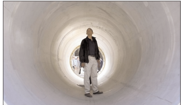
Сенатор Барак Обама находится внутри ядерного снаряда SS-24. Пермь, Россия. (28.08.05 г.)

Rush) - бывшему участнику движения "Черные пантеры".