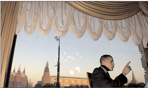
Сенатор Барак Обама дает интервью московскому телеканалу во время турне по России, Украине и Азербайджану

К началу лета, по данным социологических исследований, рейтинги Обамы и Клинтон ненадолго сравнялись, но уже в июне Хиллари удалось снова уйти в отрыв. В последующий период от-