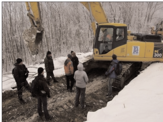
2009 г. 3, 4 и 5 января. Акция гражданского сопротивления. "Живой щит" преградил дорогу строительной технике.