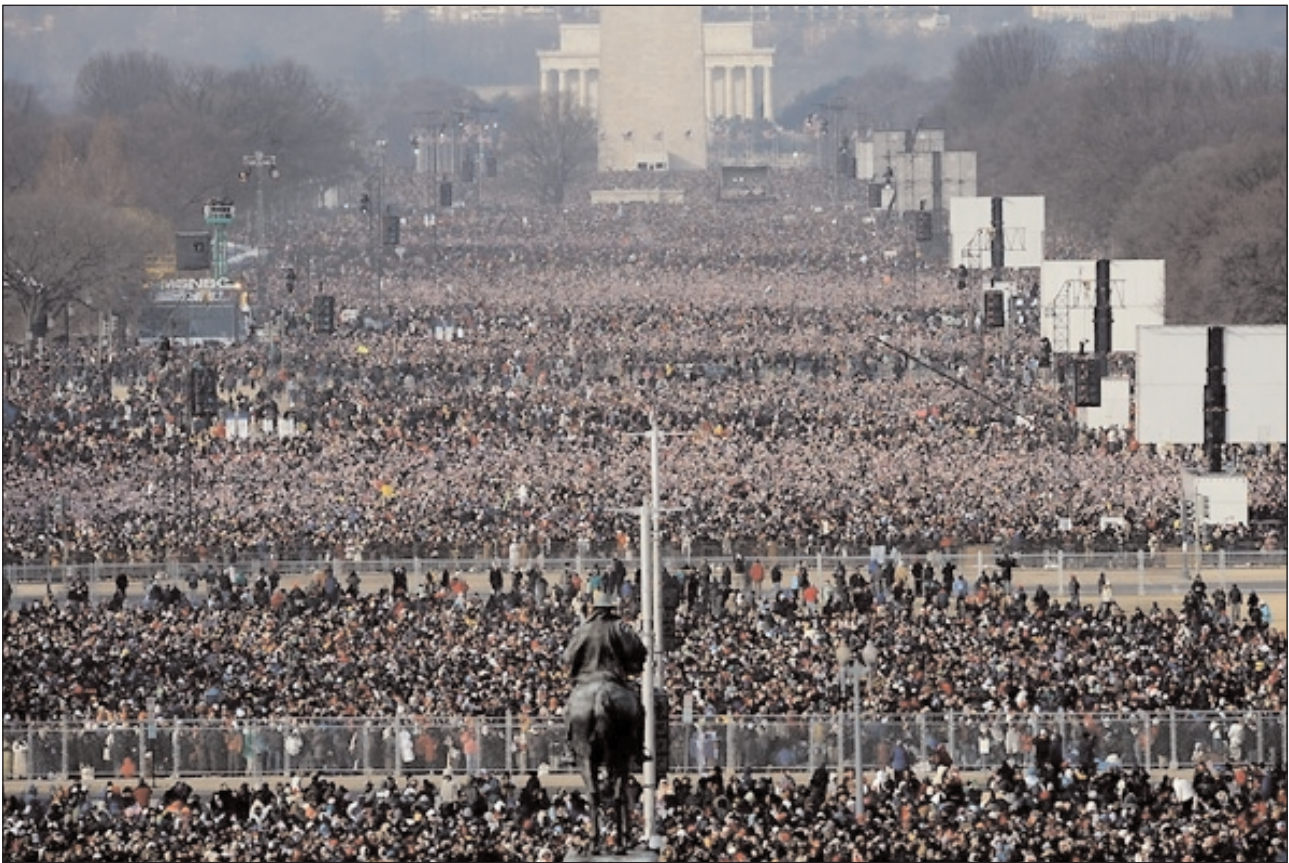
Около 4 млн. американцев прибыли в Вашингтон на инаугурацию 44-го Президента США

мужчины и женщины. И нет никакой причины изменять это универсальное и историческое определение брака, чтобы удовлетворить 2% населения планеты. Это тот вопрос, в котором соглашаются и демократы, и республиканцы. И Барак Обама, и Джон Маккейн публично заявили, что выступают против нового определения брака, которое будет вк-