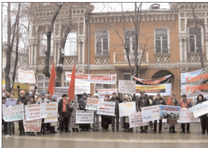
2008 г. 21 и 28 декабря. Краснодар. Пикеты против строительства дороги Сукко-Утриш.