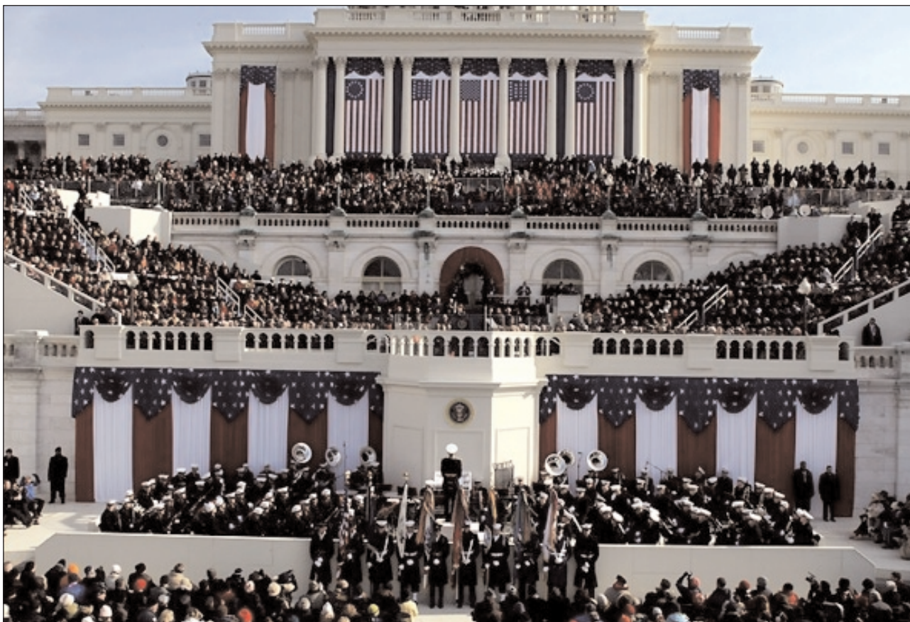
20 января 2009 г. Вашингтон. Капитолий. Инаугурация Барака Обамы.

20 января 2009 года в Вашингтоне приведен к присяге 44 президент США. Кому доверила Америка столь высокий пост? Кто он, как личность? Что ждать миру и России от нового президента США?