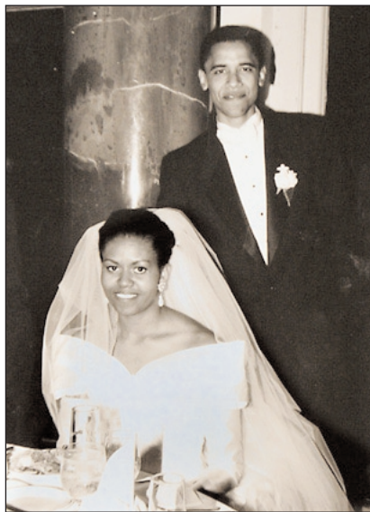
Барак и Мишель Обама во время их бракосочетания 18 октября 1992 г.

такая спокойная и такая красивая, с большими завораживающими глазами, которые, казалось, начали изучать мир, как только открылись. Малия появилась в идеальное для нас обоих время: так как я был не на сессии и преподавать летом мне было не