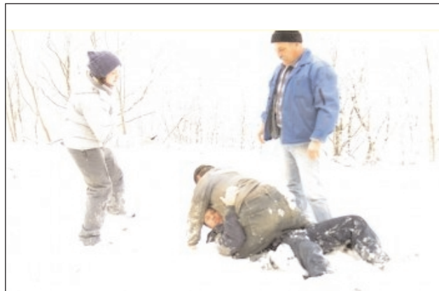
12 декабря 2009 г. Эколог лег под гусеницы эксковатора. У бульдозериста не выдержали нервы: рукопашный бой с экологом.

эффективный способ противостоять беспределу - гражданское сопротивление. Всего лишь три десятка молодых парней и девушек, продемонстрировавших гражданскую позицию, справились там, где оказались несостоятельными госслужбы, наделенные полномочиями.