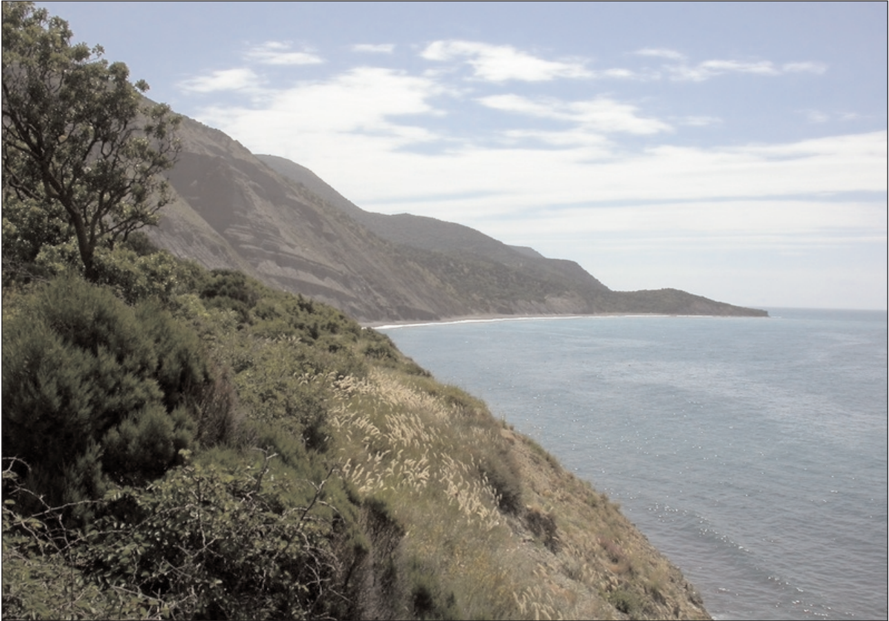
Заказник "Большой Утриш: хребты Навагирский и Абрауский