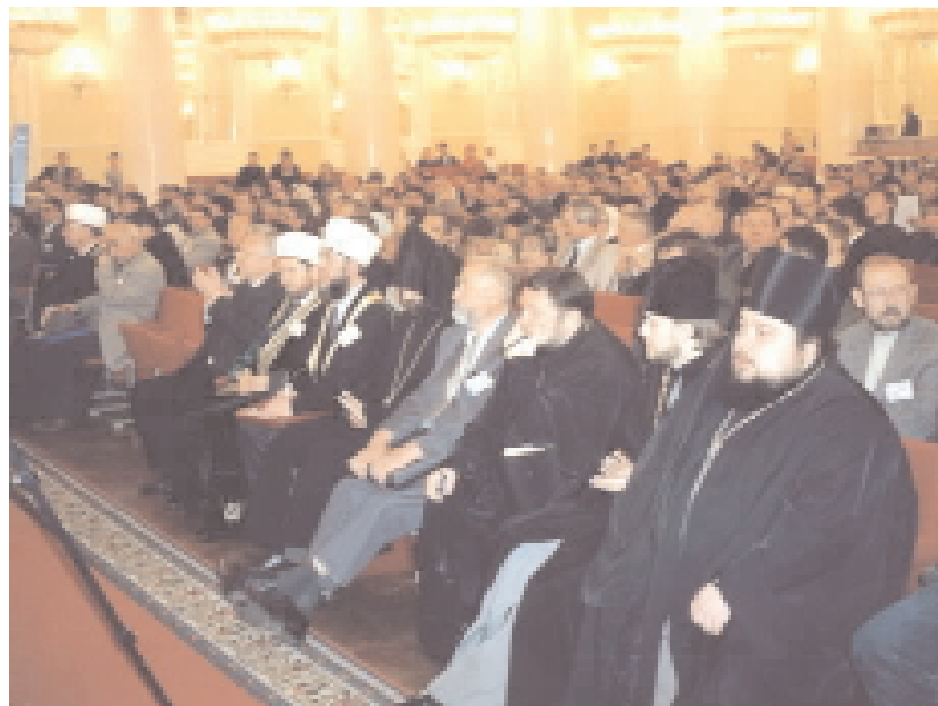
Представители различных конфессий - участники съезда

На Съезде обсуждались вопросы сплочения многонационального и поликонфессиональ-