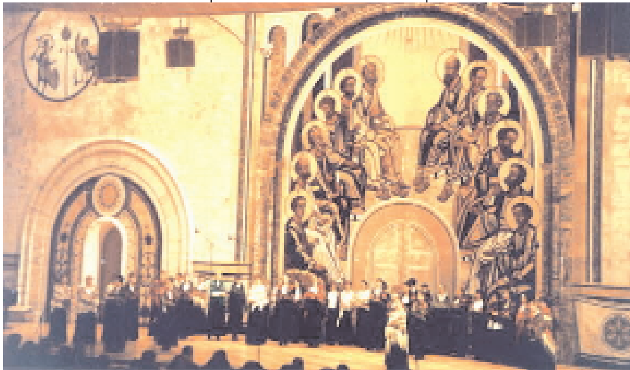
Выступление Государственной Академической хоровой капеллы им. С.Г. Эйдинова

Во втором отделении концерта прозвучали «Половецкие