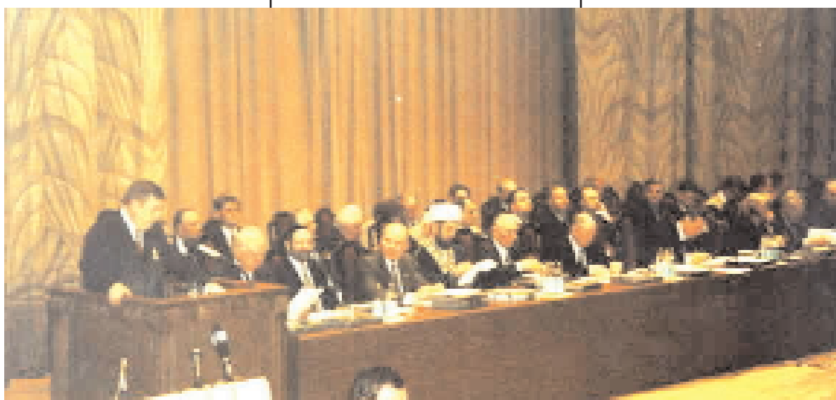
Выступление Председателя Государственной Думы Г.Н.Селезнева на II съезде Международного союза общественных объединений "Союзная общественная палата" 26апреля 2002 года

тальным свидетельством активной поддержки, которую оказывает процессу создания и укрепления Союзного государства широкая общественность Беларуси и России. Общественные объединения, входящие в состав Союзной палаты, вносят достойный практический вклад в развитие сотрудничества в сферах науки, образования, культуры, создание единого правового, экономического и информационного пространства. Современная ситуация в мире настоятельно требует от всех нас активизировать интеграционные процессы. И ключевая роль в этом