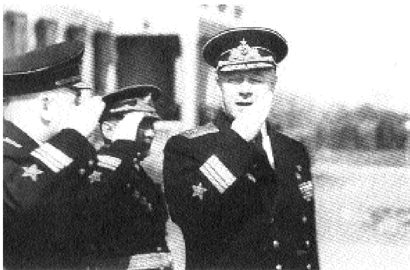
Главком ВМС - первый зам. министра обороны СССР Н.Г.Кузнецов в Ленинграде. Лето 1953 г.

ими были высшие руководители государства, он отказывался, а если учесть