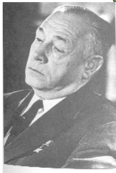
Н.Г.Кузнецов. 1972 г.

Кузнецов высказался против, за что дорого поплатился - был освобожден от руководства ВМФ. В 1948 году Н.Г.Кузнецов и ещё три адмирала были осуждены Военной коллегией Верховного Суда СССР. Они были признаны виновными в сфабрикованном деле о незаконной передаче союзникам "секретной" документации высотной парашютной торпеды и карт двух островов и южного побережья Камчатки. Однако чертежи этой торпеды, принятой на вооружения ещё в довоенном 1938 году, даже в войну