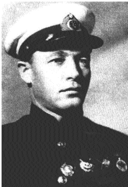
Командующий Тихоокеанским флотом Н.Г.Кузнецов. 1938 г.

Украина". За 3 года службы на крейсере он побывал во всех европейских странах, изучил и свободно владел немецким, французским, испанским языками, позже изучил и английский.